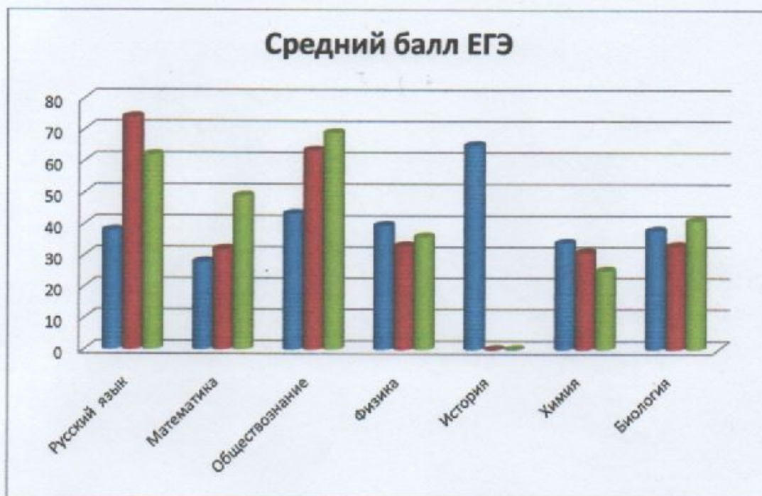
Динамика среднего балла